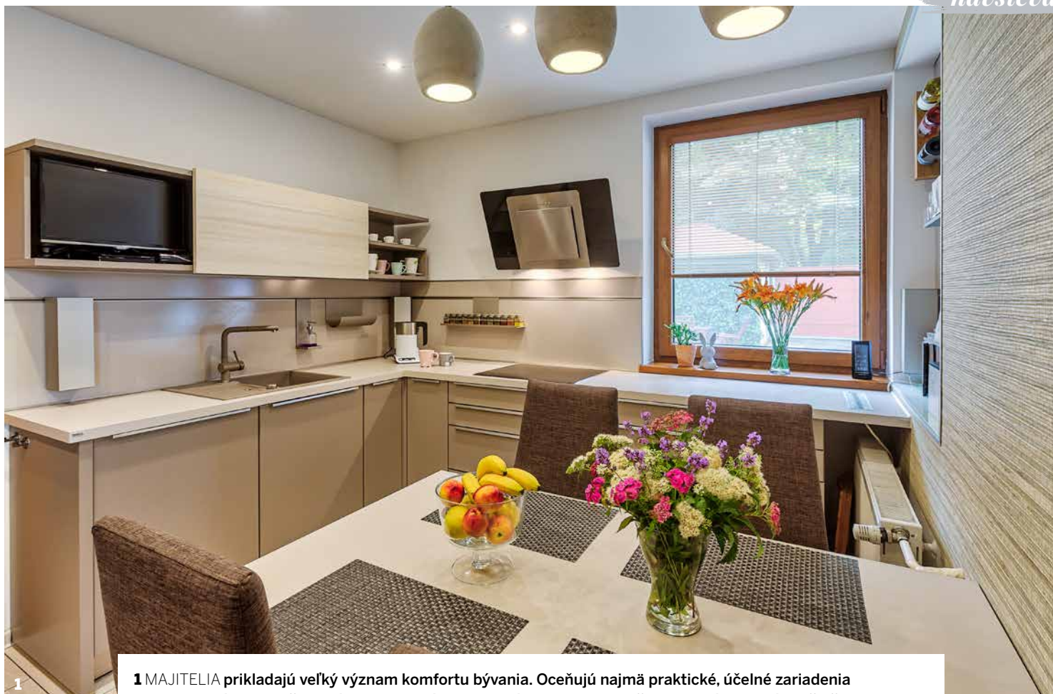
1 MAJITELIA prikladajú veľký význam komfortu bývania. Oceňujú najmä praktické, účelné zariadenia a z technických vymožeností si vybrali práve tie, ktoré im ich zabezpečia - odolné materiály a špičkovo vybavená kuchyňa. 2 ZAMUROVANÍM OKNA vznikol výklenok na praktický závesný systém. 3 ZÁHRADA je pre majiteľov oázou pokoja. Stretávajú sa tu s priateľmi, večerajú s rodinou a relaxujú – hoci aj pri kosení trávnik.